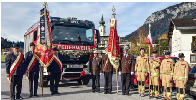
Die Fahnenabordnungen aus Söll und Mammendorf mit dem obligatorischen Bild vor dem Festakt.

Alles begann vor mehr als 62 Jahren, als die Söller Feuerwehrkameraden bei einem Ausflug ins benachbarte Bayern Kameraden von der FF Mammendorf kennen lernten. Aus diesem ersten Kennenlernen entwickelte sich in den Jahren eine Freundschaft, nicht nur zwischen den Feuerwehren, sondern es entstanden auch Freundschaften