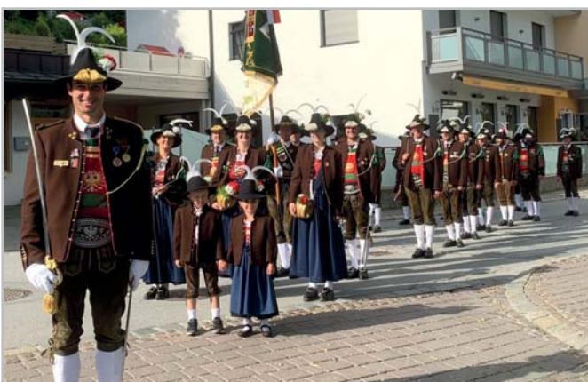
Stramme Ehrenkompanie für Fronleichnam 2022