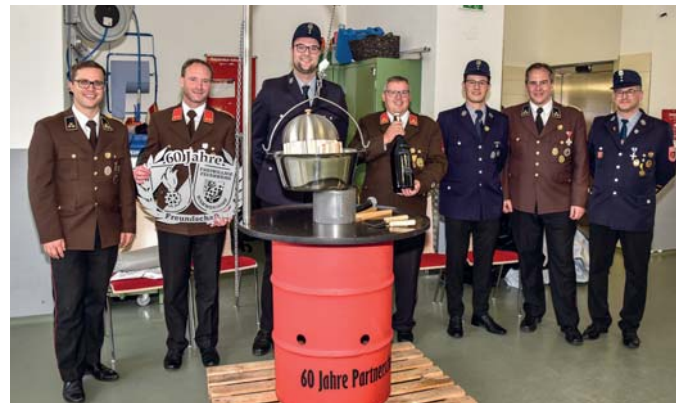
Das Kommando der FF Söll und der Vorstand der FF Mammendorf mit den Geschenken für die jeweilige Feuerwehr