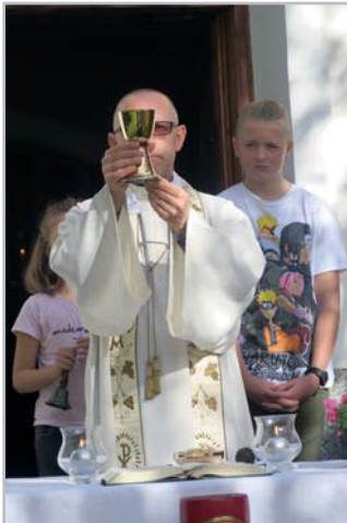
Samstag, 29. Oktober