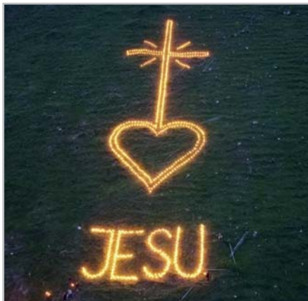
"Herz-Jesu-Feuer" 2022 am Pölven