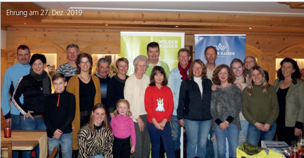
Ehrung am 27. Dez. 2019